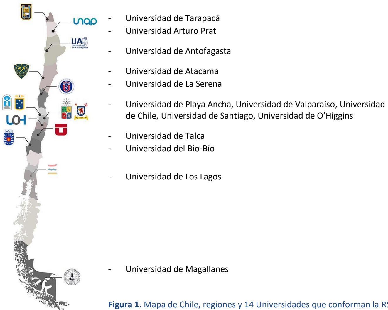
Figura 1. Mapa de Chile, regiones y 14 Universidades que conforman la RSDUE.

La RSDUE cuenta con el apoyo de cuatro instituciones externas vinculadas al ámbito de la salud digital a nivel nacional e internacional: HL7 Chile, International Digital Health & AI Research Collaborative (I-DAIR), International Telemedical Systems Chile (ITMS-AtrysHealth), y la Red de Investigación y Educación de Chile (REUNA).